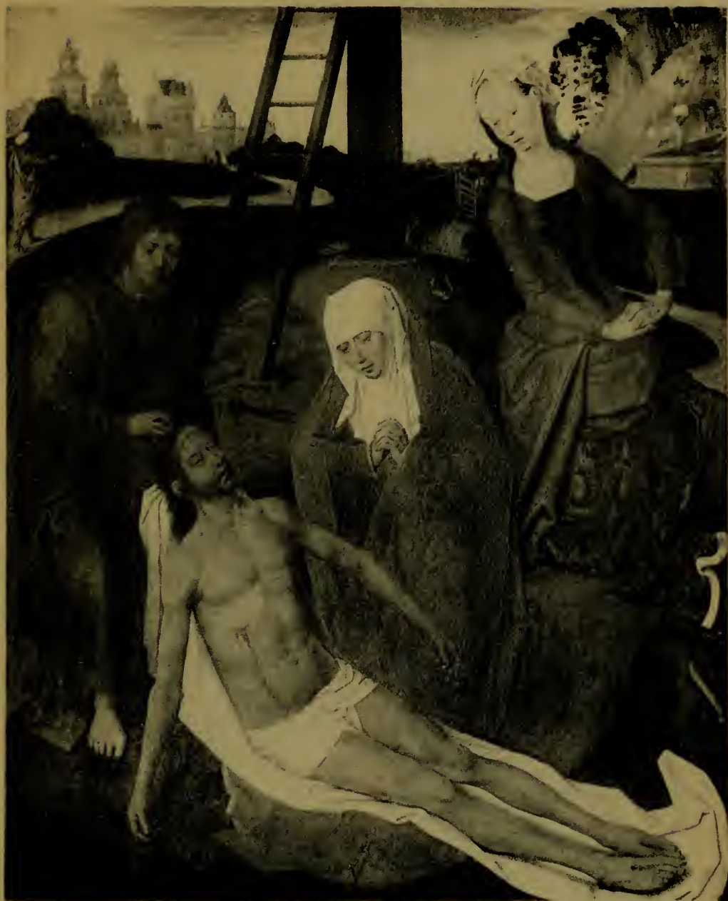
La Descente de Croix, panneau central du triptyque.